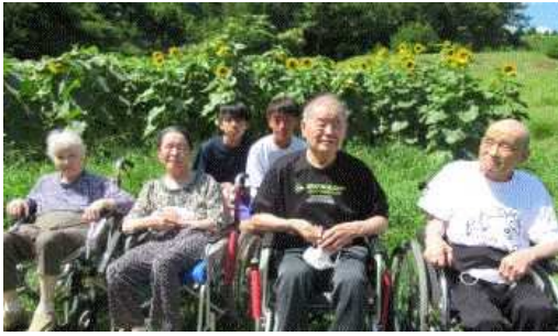
ひまわり畑にて中学生と記念撮影