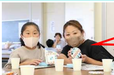
「親子で上手に出来ました。」

デザインを考えながら、コルクコースターにカラフルなガラスタイルを並べ、ボンドで接着し、乾燥させ、目地材(セメント)で隙間を埋めて：作業工程は多いものの、みなさんお話をしながら、思い思いに作られました。