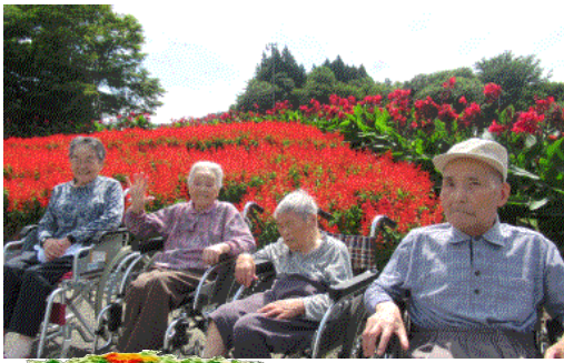
町内飲食店の花壇