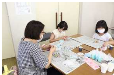
「お友達と一緒に作りました。」