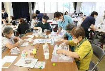
みんなで賑やかに♪